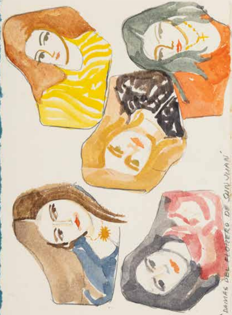
DAMAS DEL FLORERO DE SAN JUAN